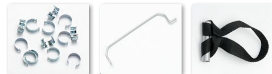
Anelle Ferma Copirete Ø 25 mm