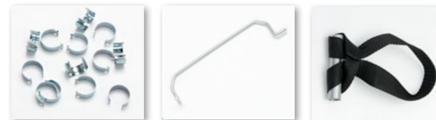
Anelle Ferma Copirete Ø 25mm Maniglia in Acciaio Maniglia in Poliestere ad Anello