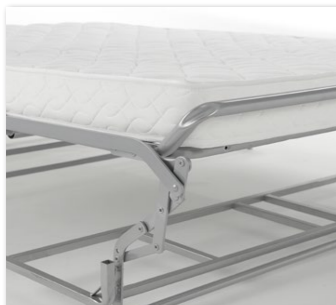
Particolare Fermamaterasso Grecale de Luxe